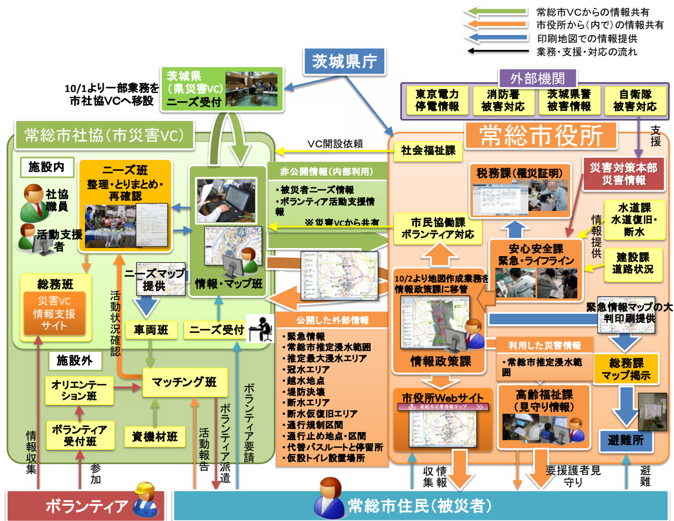
図4 常総市対応における災害情報共有の全体像 Fig. 4 Overall picture of disaster information sharing in Joso-city disaster response.