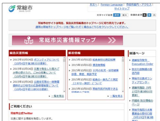
図2 常総市役所ホームページからのリンク Fig. 2 Link from Josono city hall HP.