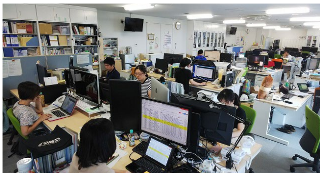
写真 1 つくば本所の災害対応 Photo 1 Disaster response at NIED Tsukuba HQ.

平成 30 年 7 月豪雨においては、霞が関を除くと 4 箇所に人員を配置しなければならなかったために、総合防災情報センターだけでは人員が不足し他の研究部門および事務部門にも依頼し、防災科研全所をあげた支援体制を構築した。