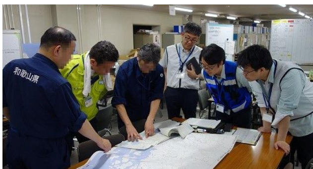
写真 2 広島県庁での災害対応 Photo 2 Disaster response at Hiroshima Pref Gov.

支援要員の業務は、被害報のような紙資料のデータ化や、個々の市町村の Web サイトで公開される給水所等の情報を毎日クローリングする作業と、現地の災害対策本部においては、地図作成申込みの記録などの事務作業であった。