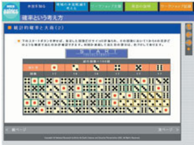
図3 Pafricsにおけるサイコロゲーム