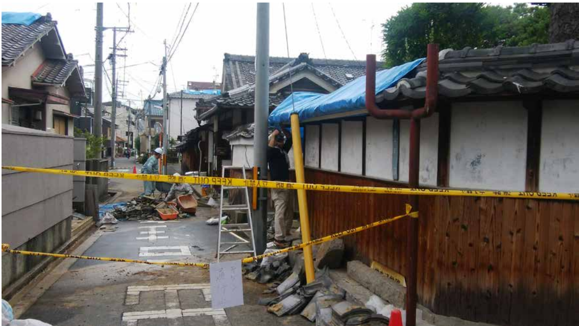
口絵 4 瓦の落下(撮影：2018年6月19日，大阪府茨木市宮元町) Fig. 4 Fall of tiles (June 19, 2018: Miyamoto-cho, Ibaraki City, Osaka).