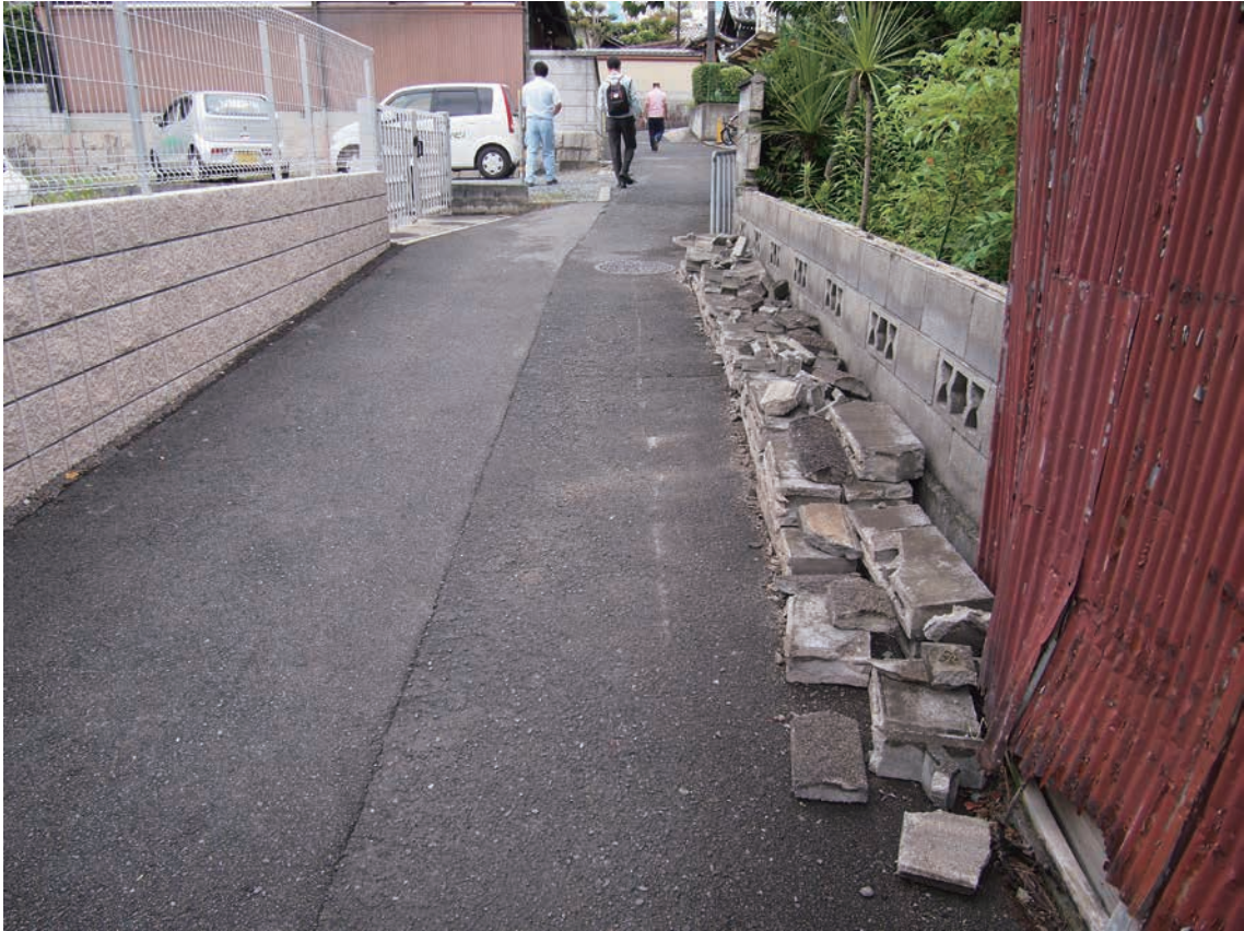
口絵 3 ブロック塀の崩落(撮影：2018年6月19日，大阪府高槻市富田6丁目) Fig. 3 Collapse of block fences (June 19, 2018: 6 Tomita, Takatsuki City, Osaka).