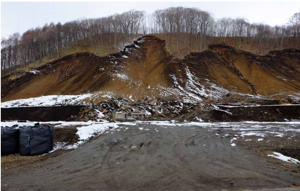
口絵 4 吉野地区の斜面災害(撮影：2018年11月25日，北海道厚真町吉野) Fig. 4 Landslides at Yoshino District (November 25, 2018: Yoshino, Atsuma-cho, Hokkaido).