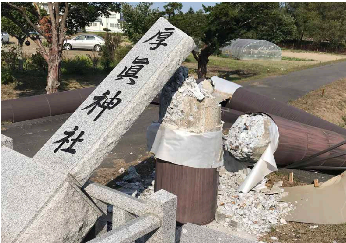
口絵 6 鳥居の折損状況(撮影：2018年9月15日，北海道厚真町新町)