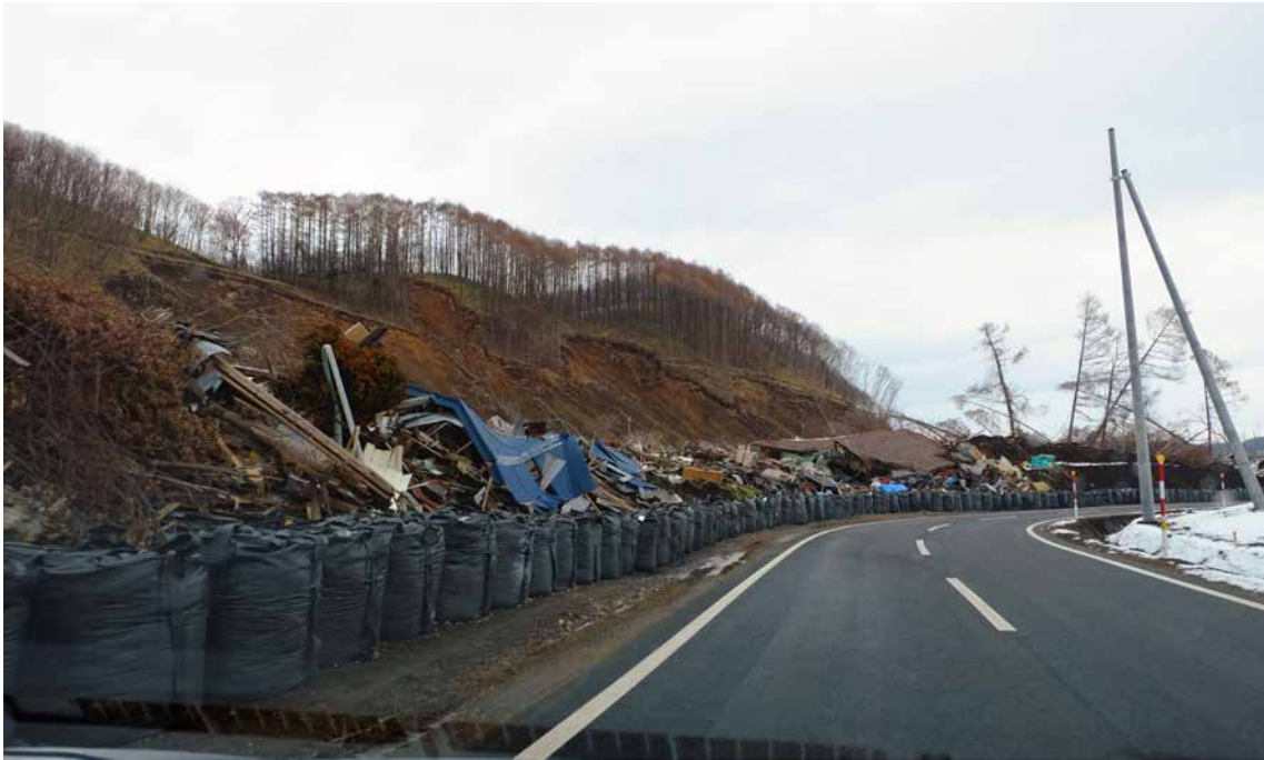
口絵 3 吉野地区の斜面災害(撮影：2018年11月25日，北海道厚真町吉野) Fig. 3 Landslides at Yoshino District (November 25, 2018: Yoshino, Atsuma-cho, Hokkaido).