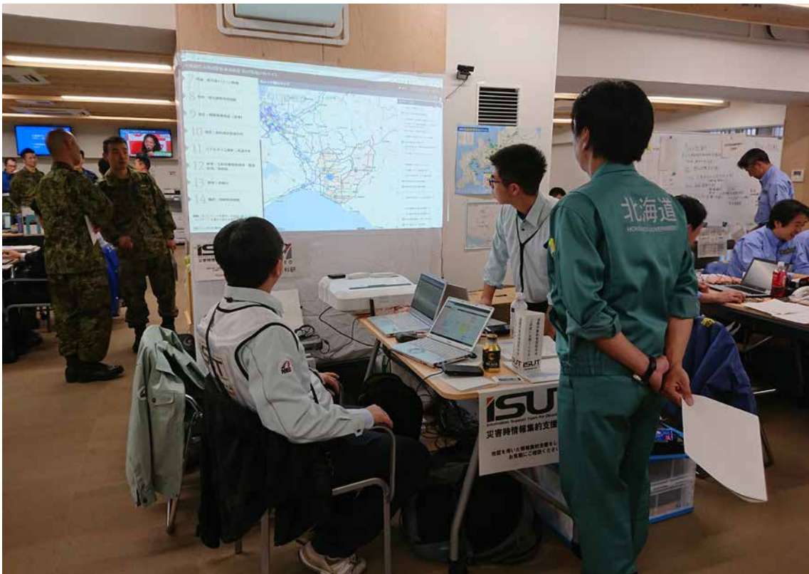
口絵8 北海道庁におけるISUTの災害情報集約支援活動(撮影：2018年9月13日、北海道庁) Fig. 8 Information-gathering support activities by the ISUT (September 13, 2018: the Hokkaido Government Office).