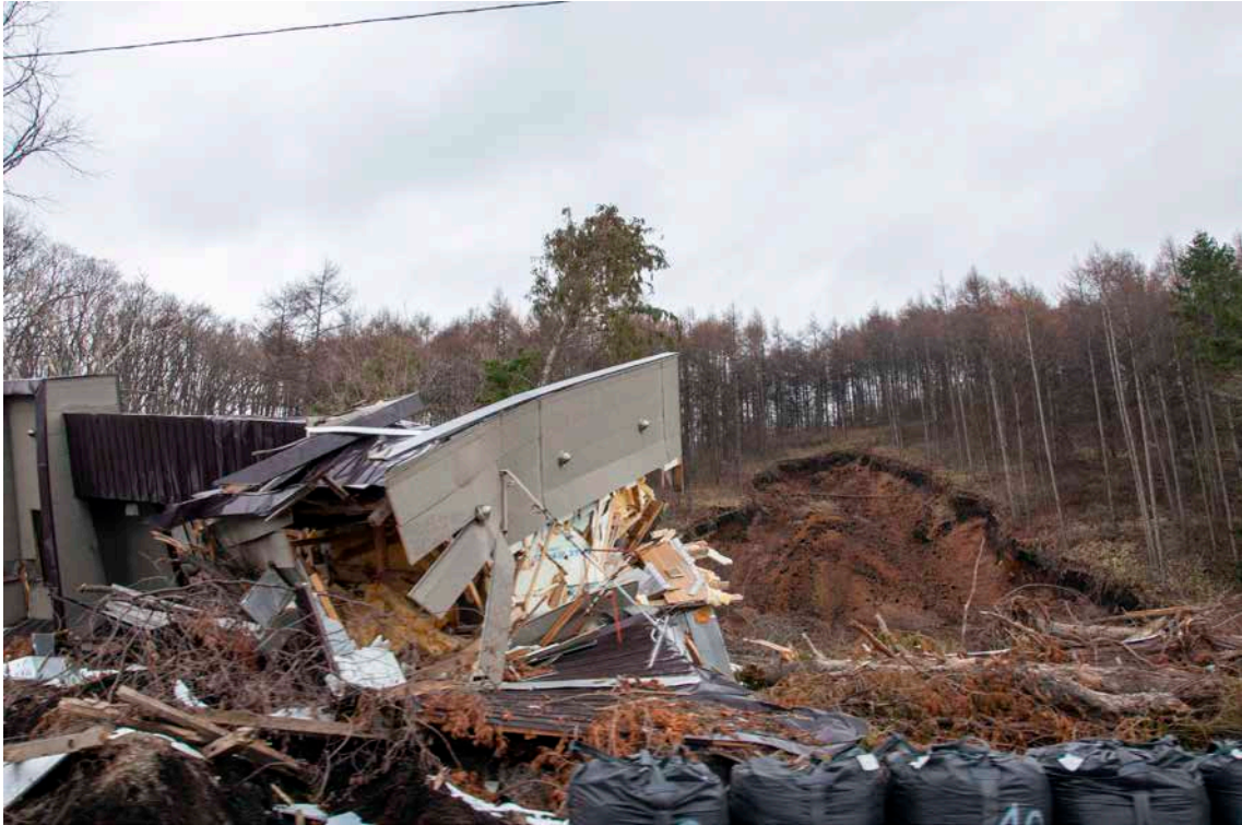
口絵 5 斜面災害による建物倒壊(撮影：2018年11月25日，北海道厚真町朝日)