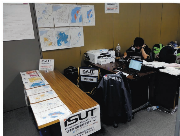
図4 ISUTの活動ブース(長野県庁)