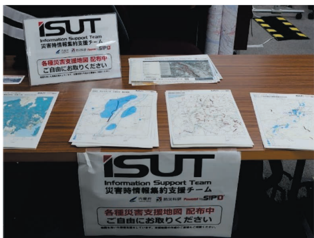
図 5 印刷地図の配布 Fig. 5 Distribution of printed maps.