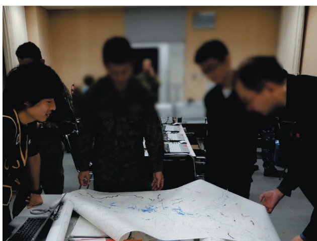
図 7 印刷地図による情報支援 Fig. 7 Information support through printed maps.

ISUT が現地が必要となる共通的な地図を印刷し、現地の地図依頼を待たず配布した。また、廃棄物対策など個別の課題解決のために、日次で地図作成、提供を行う対応を実施した。